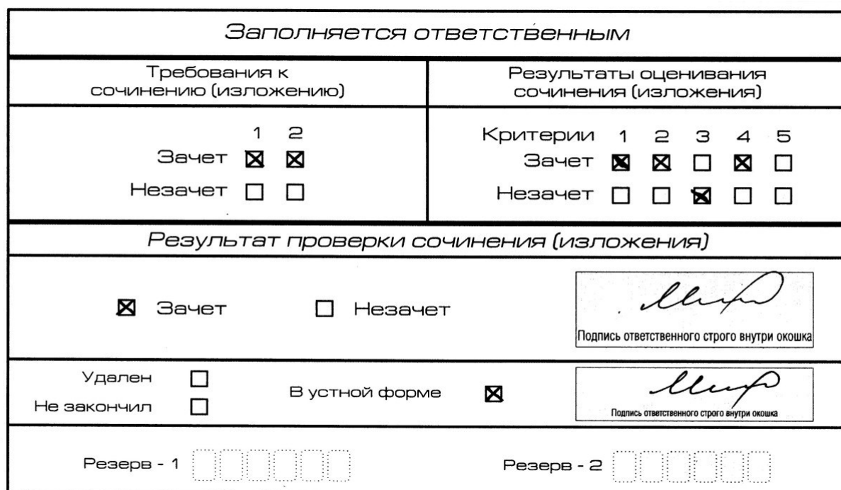
Рис. 9. Область для оценки работы сочинения (изложения) в устной форме

После окончания заполнения бланка регистрации ответственное лицо ставит свою подпись в специально отведенном для этого поле.