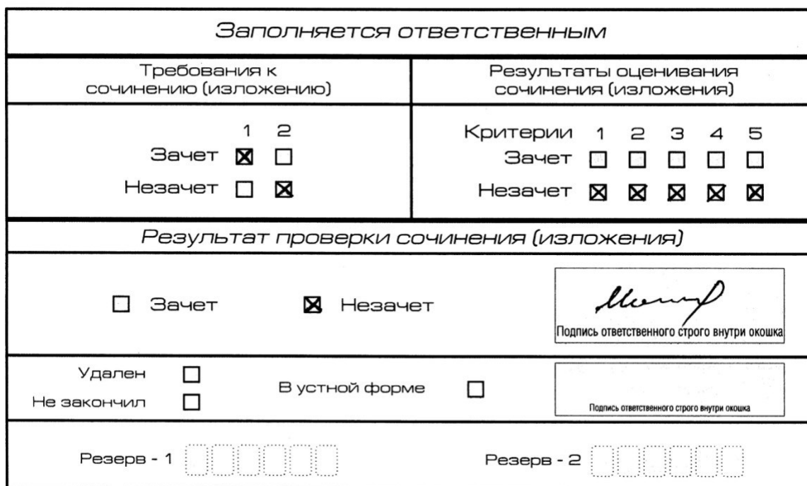
Рис. 7. Область для оценки работы

Если итоговое сочинение (изложение) соответствует требованию № 1 и требованию № 2, то выставляется «зачет» за выполнение требования № 1 и требования № 2. Указанные сочинения (изложения) далее оцениваются по критериям.