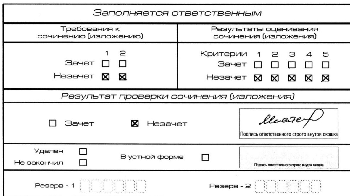
Рис. 6. Область для оценки работы